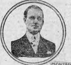
SIR PATRICK HASTINGS